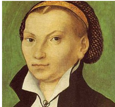
Katharina von Bora, Luthers Ehefrau

Im Preis von 435,00 € sind 6 Übernachtungen, Frühstück und Abendessen, die Busfahrt, ein Theaterbesuch, gemeinsames Essen auf der Hin - oder - Rückfahrt sowie die Ausflüge mit den Eintrittspreisen enthalten.