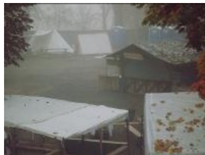
Das Ende des Konfirmandentreffens am 31. 10. mit Martin Luther und einer schwedi-

Danach fanden sich alle auf dem mittelalterlichen Markt wieder, der im Schloßinnenhof und der gesamten Stadt die Aufmerksamkeit auf sich lenkte. Unsere Konfirmandinnen und Konfirmanden fotografierten und befragten Passanten. Die Ergebnisse gibt es am 11. 03. 2012 im Vorstellungsgottesdienst zu sehen.